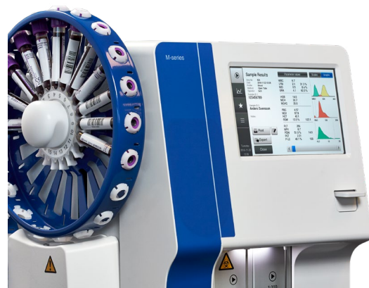
Los analizadores M-series M32S con cargador automático son ideales para hospitales pequeños y medianos que necesitan funcionalidades de análisis autónomas.