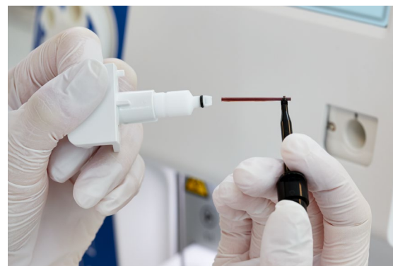
Los analizadores Medonic M-series M32 proporcionan un hemograma completo a partir de tan solo 20 µl de sangre, por lo que son extremadamente adecuados para niños y bancos de sangre.

Aunque disfrutará trabajando con su analizador Medonic, habrá ocasiones en las que tendrá que alejarse del sistema y dejar que analice un lote completo de muestras sin su supervisión. En estos casos, el modelo M32S es el equipo perfecto para su mesa de trabajo. Como modelo de gama alta, Medonic M-series M32S es el analizador autónomo idóneo para muchos hospitales pequeños y medianos. Basta con precargar hasta 2 x 20 muestras y dejar que haga todo el trabajo.